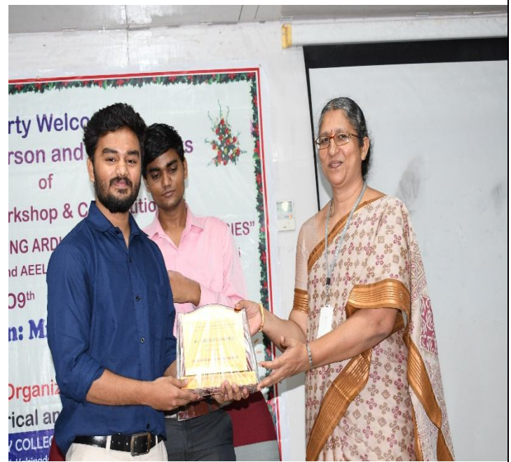
HOD of EEE Felicitating Resource person with a Memento.