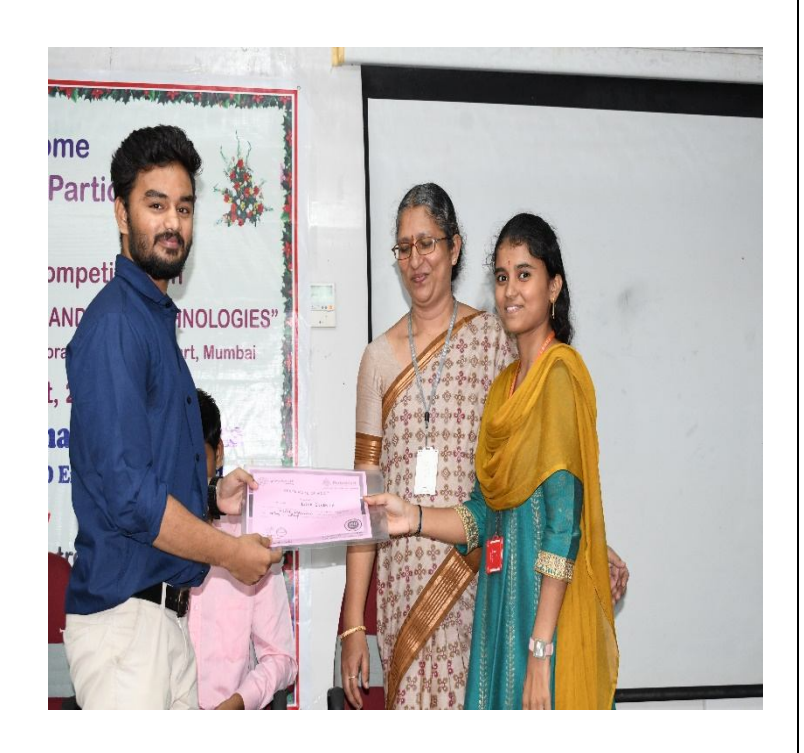
Resource person presenting certificate to the participant.